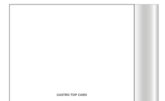
Impressum auf U4: Gastrotopcard