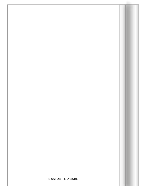
Impressum auf U4: Gastrotopcard