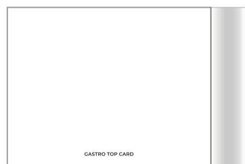
Impressum auf U4: Gastrotopcard